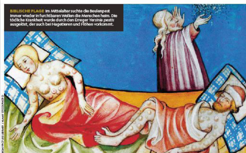
BIBLISCHE PLAGE Im Mittelalter suchte die Beulenpest immer wieder in furchtbaren Wellen die Menschen heim. Die tödliche Krankheit wurde durch den Erreger Yersinia pestis ausgelöst, der auch bei Nagetieren und Flöhen vorkommt.

ENTDECKER und Namensvetter des Pesterreger war der schweizerisch-französische Arzt und Bakteriologe Alexandre Émile Jean Yersin. Im Auftrag der französischen Regierung und des Institut Pasteur gelang ihm im Jahr 1894 die Isolierung des Pestbakteriums. Das Foto unten zeigt den Kieferknochen eines vor circa 5000 Jahren in Lettland begrabenen Mannes. Darin haben Forscher jetzt Teile des Erbguts von Yersinia pestis identifiziert.